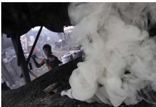
Un trabajador rodeado de sustancias contaminantes.

Contaminantes y sustancias tóxicas resultantes de actividades industriales amenazan la salud de 125 millones de personas en el mundo, especialmente en los países en vías de desarrollo, donde 80 millones están en riesgo de morir prematuramente o perder calidad de vida por causa de este contacto.